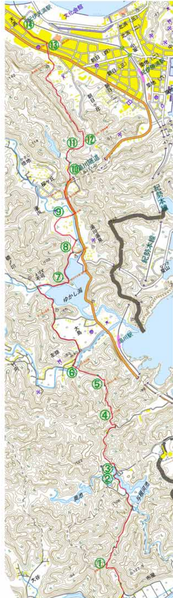
⑩13:39木材屋さんの中を通る