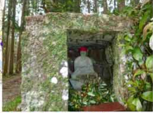
⑦八郎山頂に寄り道