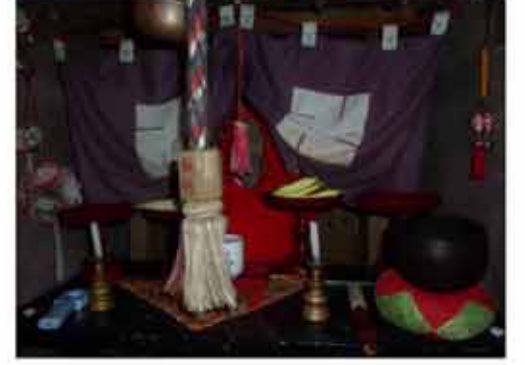
加寿地蔵・一の姫