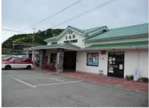
①11:45市屋バス停に到着