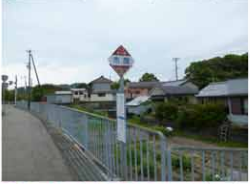
③12:04大泰寺(参拝は無し)