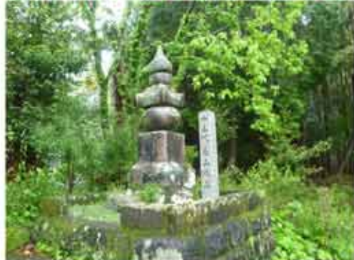
⑧13:16十三代亀山城主の墓