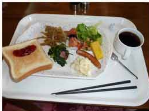
7:28 朝食 (バイキング)