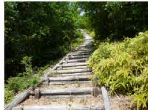
④10:31 ひたすら続く木の階段