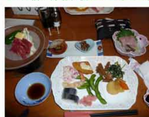
16:00宿に帰着、後はいつものとおり