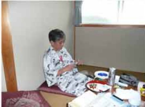
16:05 一風呂浴びたらまずビール