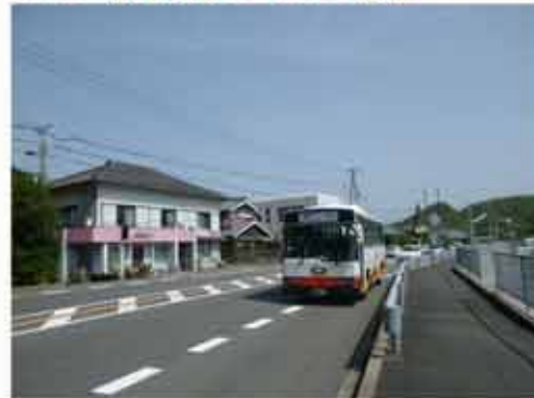
9:36 熊野交通バスに乗車