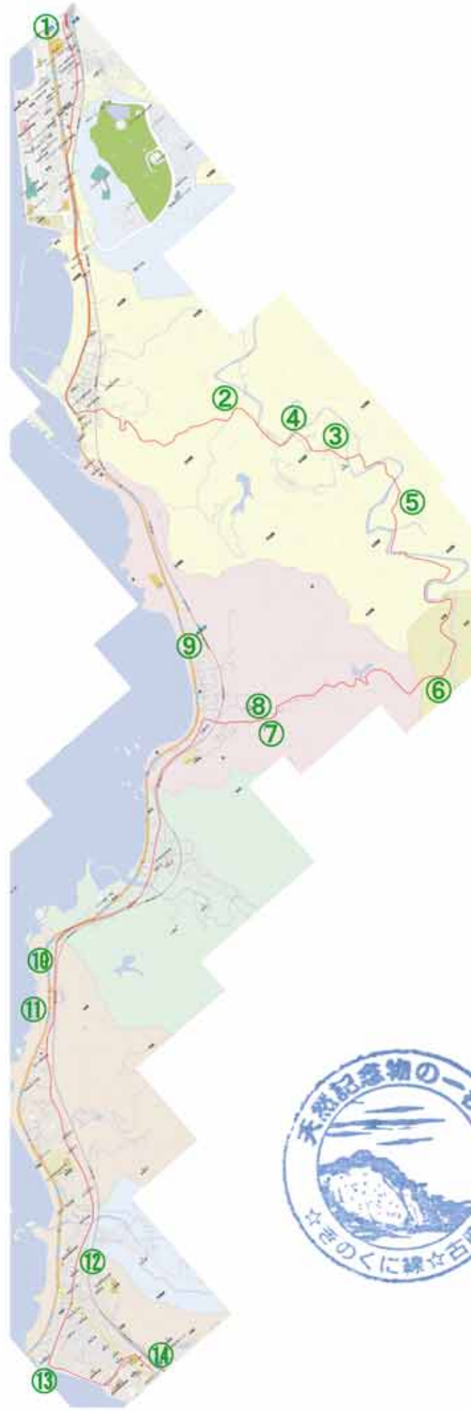
⑧ 12:45 地蔵