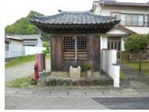
⑬ 13:52 古座川渡し場跡