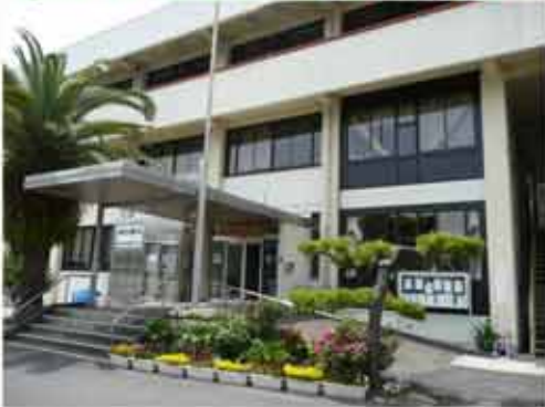
④13:13 古座川町役場(トイレを借りる)