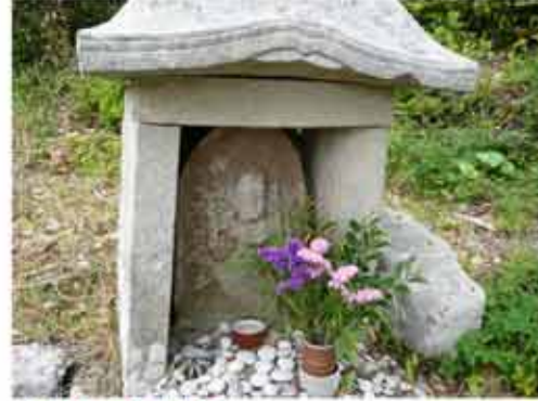
⑩ 13:22 地蔵