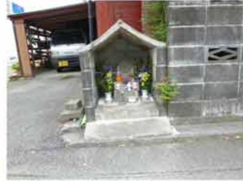
⑫ 13:42 原町の小堂