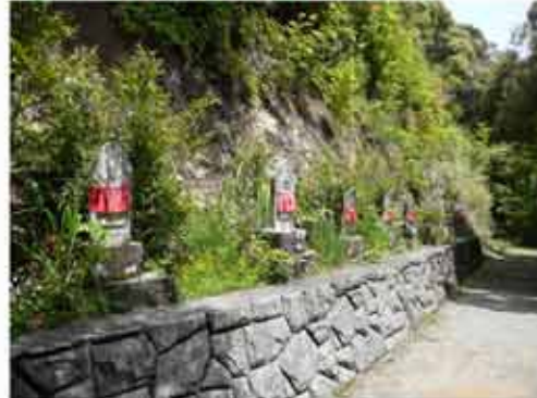
⑤11:09 神王寺境内に入る