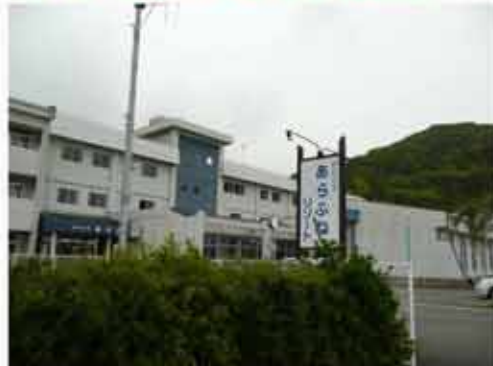
15:06 リゾートあらふね到着