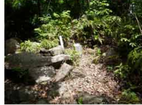
⑥11:17 重畳山山頂の三角点