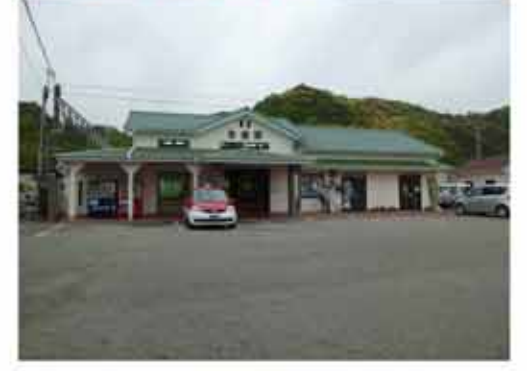
14:43の列車で紀伊田原へ