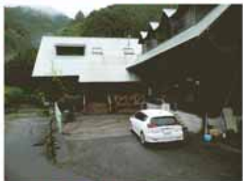
夜半から本降りの雨