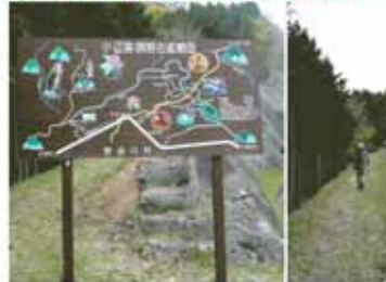
③11:50 水ヶ峰分岐（再び地道）