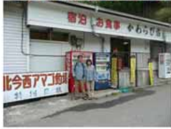
7:25 出発 (大股まで送ってもらう)