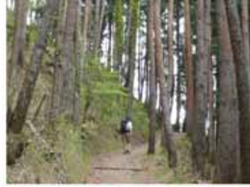
④8:20 萱小屋跡 (以前は人が住み、子供は毎日山道を通学したと言う)