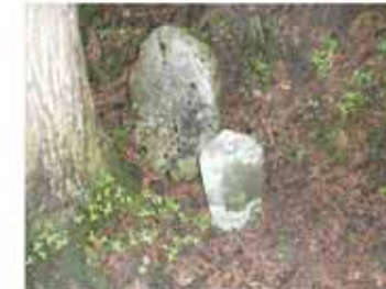
⑧9:25 三浦峠（東屋で休憩していると再び雨）