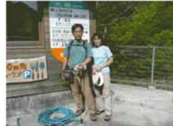
⑪15:15 宿は民宿かわらび荘