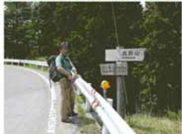
①11:25 幼行い合流（暫く舗装路）