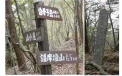
⑥9:55 伯母子岳分岐 六字名号碑