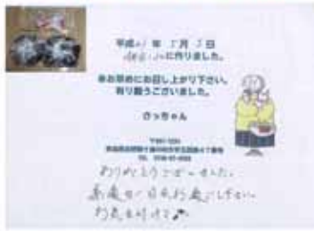
岡田のおにぎり弁当 (宿で撮影)