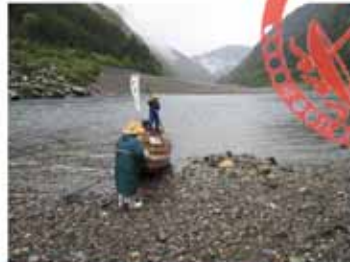
途中から本降りの雨で、寒かった。