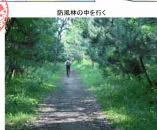
防風林の中を行く