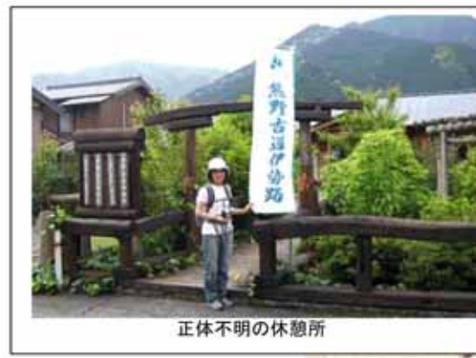
正体不明の休憩所