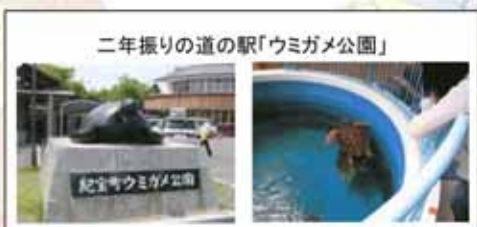
二年振りの道の駅「ウミガメ公園」