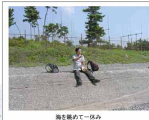
海を眺めて一休み