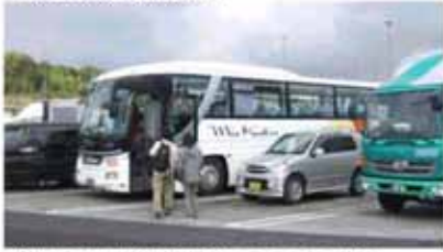
新型バスは「熊野古道」のラッピング無し。 ちょっと寂しい。