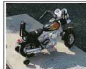
ホンダヒートバイク??