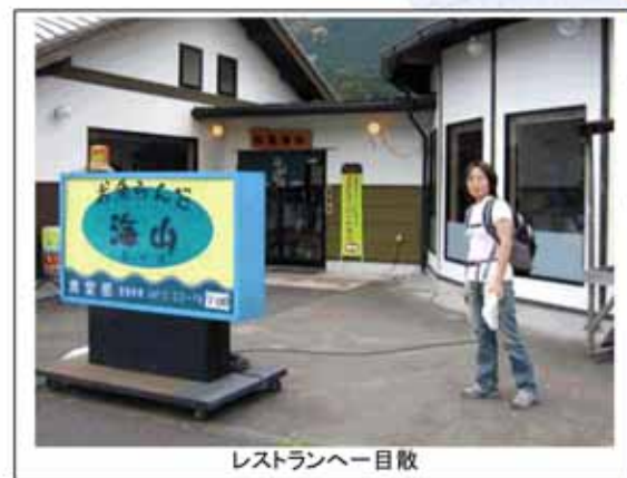
レストランへ目配