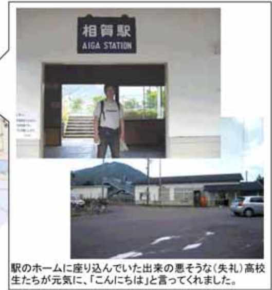
駅のホームに座り込んでいた出来の悪そうな(失礼)高校生たちが元気に、「こんにちは」と言ってくれました。