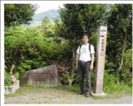
熊野古道センター