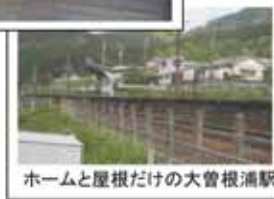
ホームと屋根だけの大曾根浦駅