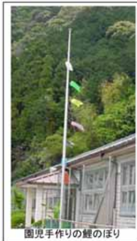
園児手作りの鯉のぼり